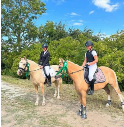
PAS DIV III